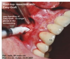
Root-top resection with Easy-Graft

Vullen van holtes (zysten, aveolen, wortelpuntresektieholtes, sinusbodemlevatie) Opbouw van verloren gegaan bot (augmentatie). Botmateriaal easy-graft™ is deegachtig/pasteus, blijft liggen en laat zich perfect modelleren tot het uithardt. Bij kleine defecten is geen membraan nodig.